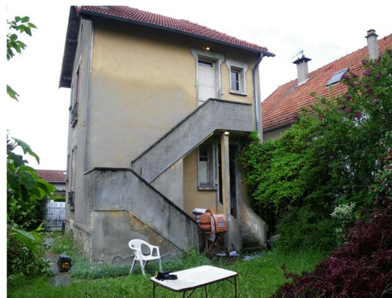
PCMI 8 - Visuel de près