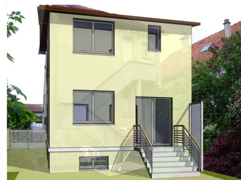
PCMI 6 - Visuel de près après les travaux

Objet de la Demande Permis de Construire Extension Parcelle DP 01 - 05 25, rue de l'Étang 94500 - Champigny sur Marne