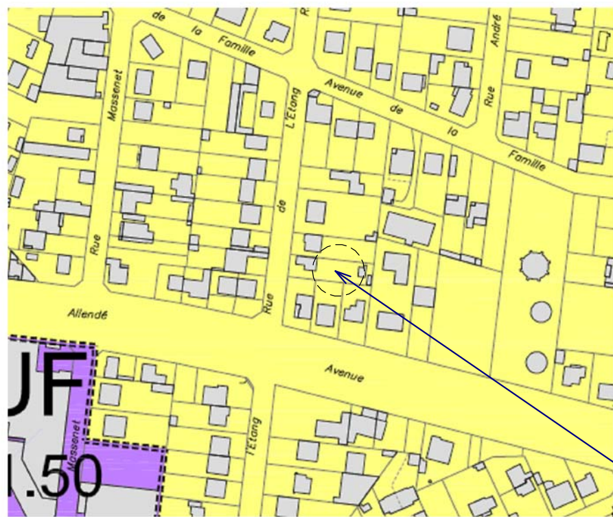
PCMI 1 - Plan de situation